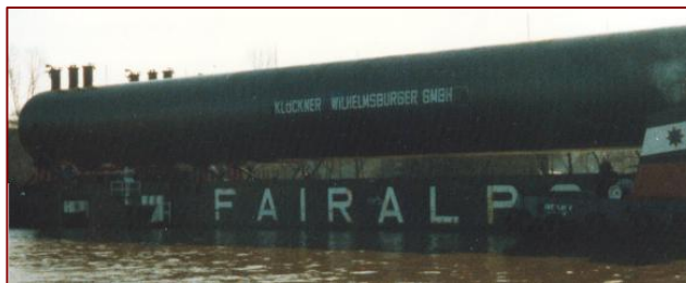
Drei dieser „monströsen“ Objekte wurden über den Fähranleger Brunsbüttel-Süd vom Wasser aufs Land und per Schwertransport zur „Elf-Bitumen“ transportiert.

„Brunsbüttel soll grüner werden“ heißt die Devise der Stadtverwaltung. 4.450 Bäume und 214.000 Büsche werden in verschiedenen Anlagen gepflanzt. Mit den Biotopen werden Regenerationsgebiete für Flora und Fauna geschaffen.