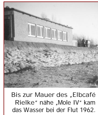
Bis zur Mauer des „Elbcafé Rielke“ nahe „Mole IV“ kam das Wasser bei der Flut 1962.

Dass auch im 20. Jahrhundert noch vernichtende Sturmfluten auftreten, zeigt sich am 16. Und 17. Februar. Orkanartige Stürme drücken das Nordseewasser in die Elbe bis Hamburg. An Brunsbüttels Deichen gibt es zwar starke Abbrüche, doch sie halten. Während in Brunsbüttel kein Einwohner sein Leben ließ, rissen die Wassermassen in Hamburg insgesamt 315 Menschen in den Tod.