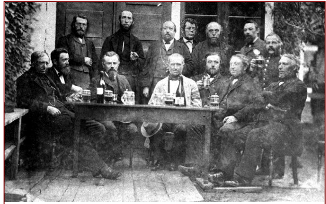
Eines der ältesten Fotos aus Brunsbüttel: 13 berühmte Kegler und ein Mann, der sich „eingeschmuggelt“ haben soll (vierter von links, stehend).

Die bereits bestehende Marschenbahn von Hamburg-Altona nach Itzehoe wird 1878 bis nach Heide verlängert. Der nächste Bahnhof für die Brun-