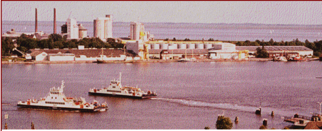
Blick auf Kanalfähren und Elbe. Oberhalb der Fähren die „Kali-Chemie“, die 1982 abgerissen werden muss.

Am 22. Juni wird vom Sozialministerium Schles-