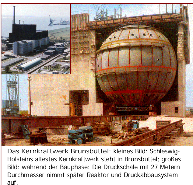
Das Kernkraftwerk Brunsbüttel: kleines Bild: Schleswig-Holsteins ältestes Kernkraftwerk steht in Brunsbüttel; großes Bild: während der Bauphase: Die Druckschale mit 27 Metern Durchmesser nimmt später Reaktor und Druckabbausystem auf.

Ministerpräsident Gerhard Stoltenberg und der Vorstand der „Veba AG“ legen am 10. Juni den