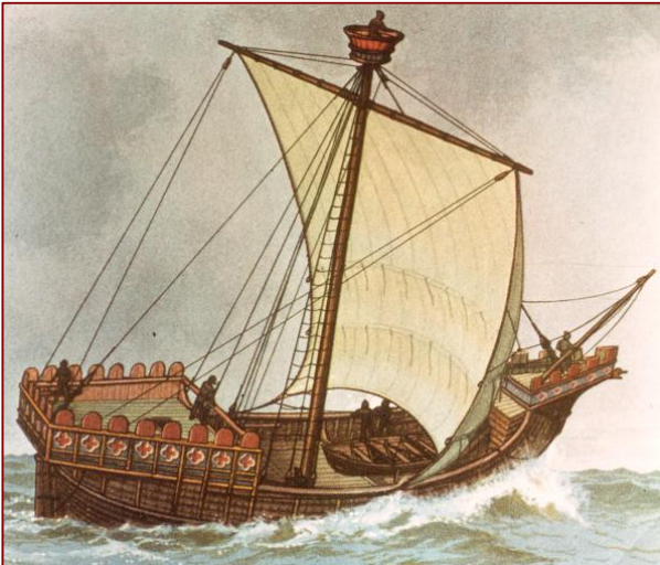
Diese Schiffe waren es, die gerne von den Brunsbüttelern überfallen und beraubt wurden...

dorfer Dom nach Heide gebracht und dort auf dem Scheiterhaufen verbrannt.