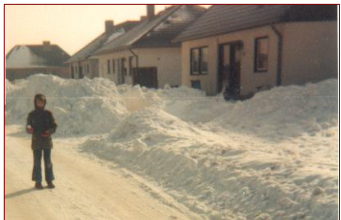
Meterhoher Schnee lag nach Verwehungen im Februar 1979 wie hier im Theodor-Heuss-Ring auf allen Brunsbütteler Straßen.

Mit dem Abriss des Gasthofes „Saturn“, auch be-