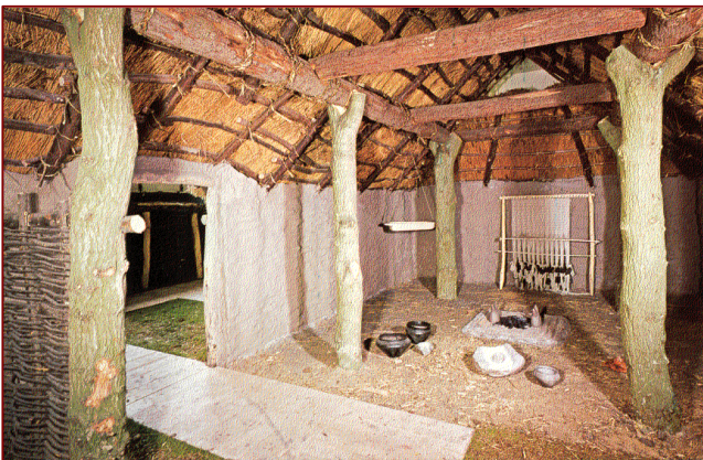
Bauernkate zur römischen Kaiserzeit: So sollen die Menschen in Ostermoor etwa gelebt haben. Dieses Modell steht im Heider „Museum für Dithmarscher Geschichte“.