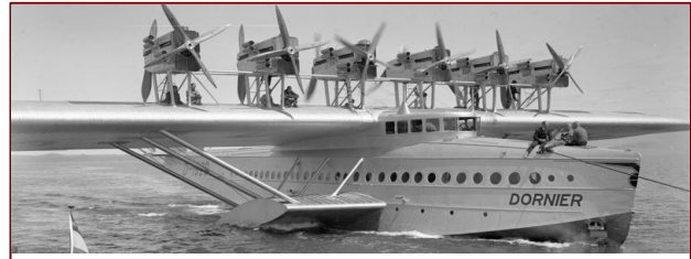
Die „Do-X“ oder auch „Dornier“ der „Deutschen Lufthansa“ war die einzige ihrer Art und landete in Brunsbüttel!

Blau- oder Finnwale sind in der Schleuseneinfahrt ungewöhnlich. Umso größer ist die Aufregung, als sich ein Tier von acht Metern Länge und etwa 120 Zentnern Gewicht im März hierhin verirrt. Auch „Wollhandkrabben“ nehmen zu diesem Zeitpunkt