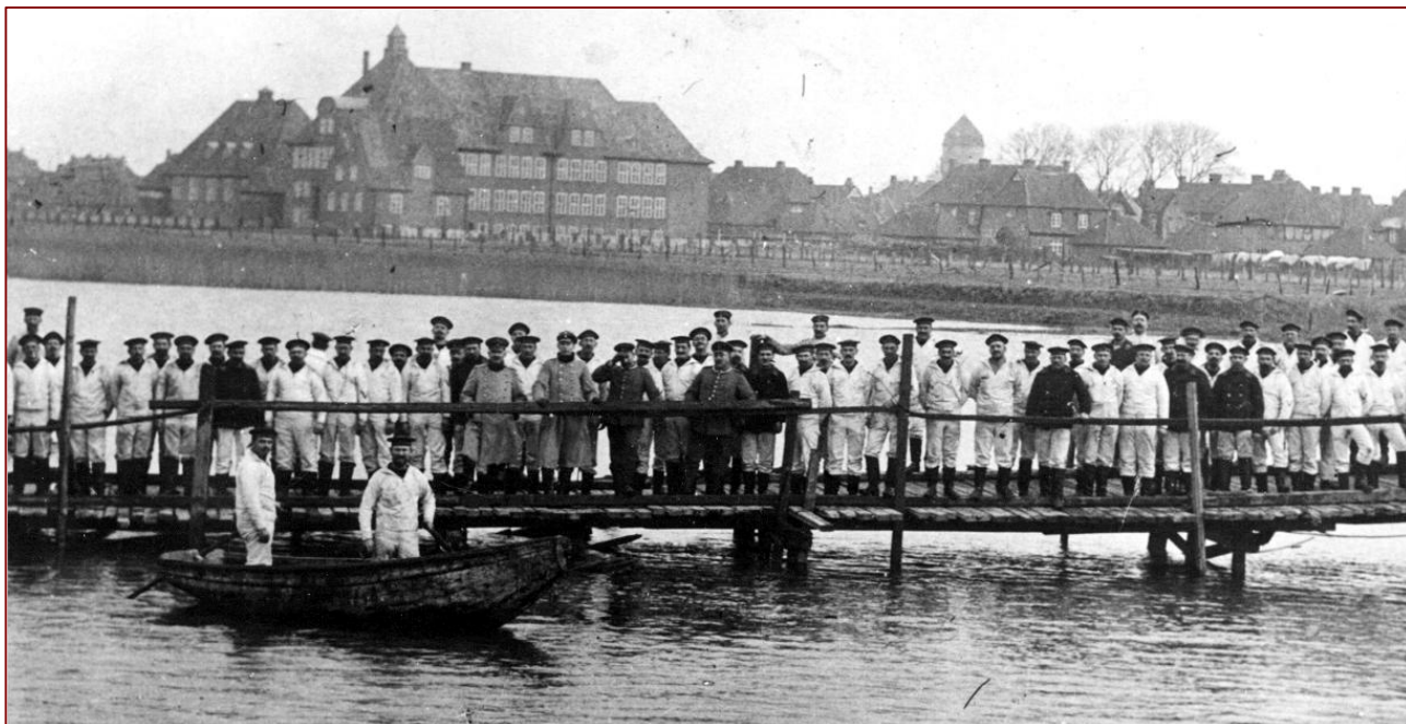
Die Pioniere der „Seewehr“ errichten mit der Realschule im Hintergrund im Zuge der „Koogstraße“ eine Behelfsbrücke.

Die ersten Luftaufnahmen von Brunsbüttelkoog werden 1912 von Luftschiffen aus gemacht. Insgesamt waren es fünf verschiedene starre Luftschiffe, die den Ort fotografierten: Am 11. Juli 1912 „LZ 11 – Viktoria Luise“, 17. August, 24 September 1912 und 18. September 1913 „LZ 13 – Hansa“, 14. Februar 1914, 2. März 1914 mit Graf Zeppelin „LZ 17 – Sachsen“ sowie am 28. März 1936 bei